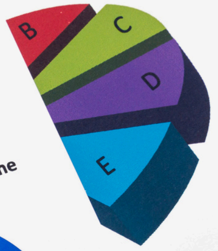
Quarterly Report of Trade Volume