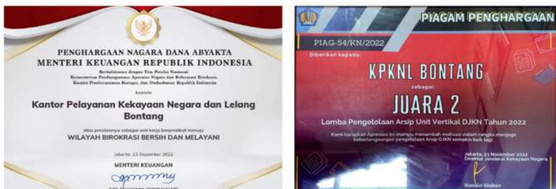
Gambar III.1 Penghargaan yang diperoleh KPKNL Bontang Tahun 2022

Perolehan NKO yang tinggi pada Tahun 2022 didukung oleh keberhasilan IKU pada masing-masing subbagian/seksi yang mencapai target, perolehan Unit Kerja Berpedikat ZI-WBBM dengan nilai sebesar 94,97 yang berpengaruh terhadap Nilai Kinerja Organisasi. Prestasi lainnya yang dicapai oleh KPKNL Bontang pada Tahun 2022 adalah Juara II Lomba Pengelolaan Arsip Unit Vertikal DJKN.