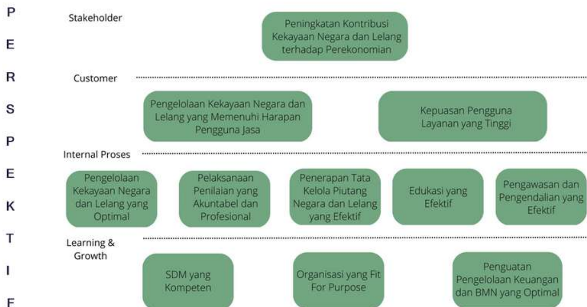
Grafik II.1 Peta Strategis KPKNL Bontang

Peta Strategis DJKN mempunyai 4 perspektif, yaitu: stakeholders perspective , customer perspective , internal process perspective , dan learning and growth perspective . Dari Peta Strategis KPKNL Bontang Tahun 2022 tersebut diketahui bahwa jumlah sasaran strategis yang dikembangkan oleh KPKNL Bontang mencapai 11 (sebelas) sasaran strategis dan Indikator Kinerja Utama (IKU) yang diidentifikasi sebanyak 20 (Dua puluh) IKU. Selanjutnya, keterkaitan antara sasaran strategis dan IKU dapat disajikan dalam tabel berikut: