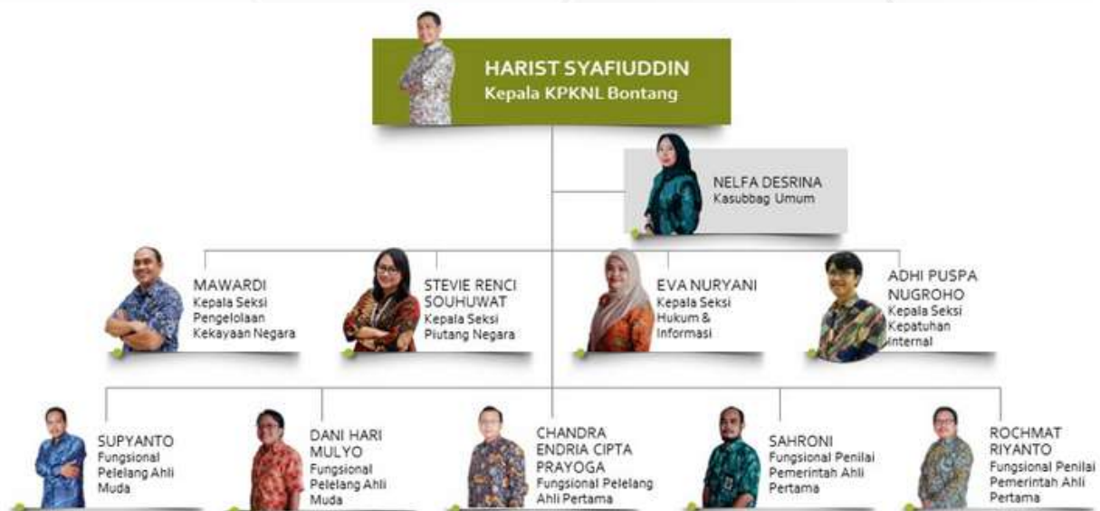
Gambar 1.1 Struktur Organisasi

Adapun bagan struktur organisasi KPKNL Bontang Tahun 2022 sebagai berikut :