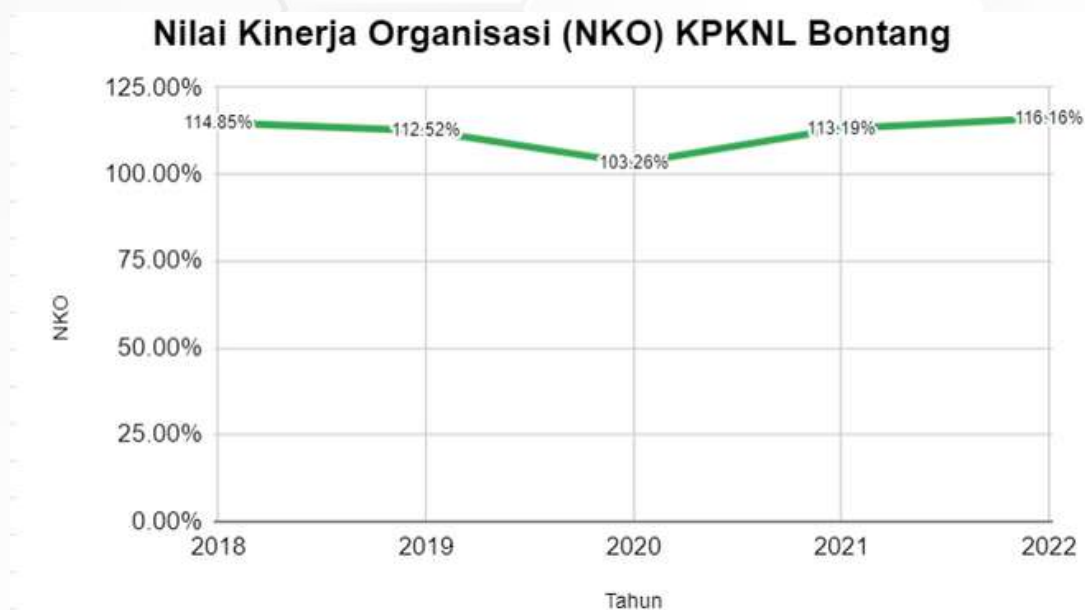
Grafik III.1 NKO KPKNL Bontang Tahun 2018-2022

Perolehan NKO yang tinggi pada Tahun 2022 didukung oleh keberhasilan IKU pada masing-masing subbagian/seksi yang mencapai target, perolehan Unit Kerja Berpedikat ZI-WBBM dengan nilai sebesar 94,97 yang berpengaruh terhadap Nilai Kinerja Organisasi. Prestasi lainnya yang dicapai oleh KPKNL Bontang pada Tahun 2022 adalah Juara II Lomba Pengelolaan Arsip Unit Vertikal DJKN.