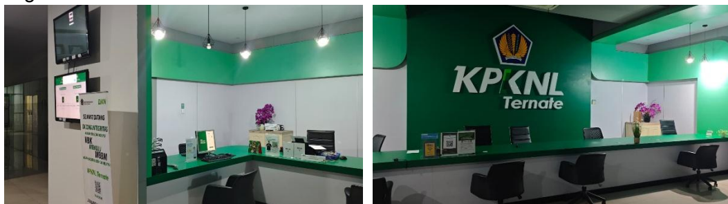
Foto ruang Area Pelayanan Terpadu

Pelayanan pada APT KPKNL Ternate sudah diimplementasikan menyesuaikan dengan standar Area Pelayanan Terpadu yang diatur dalam Keputusan Direktur Jenderal Kekayaan Negara nomor KEP-40/KN/2024 tentang Pedoman Pengelolaan Layanan Informasi di Lingkungan Direktorat Jenderal Kekayaan Negara.