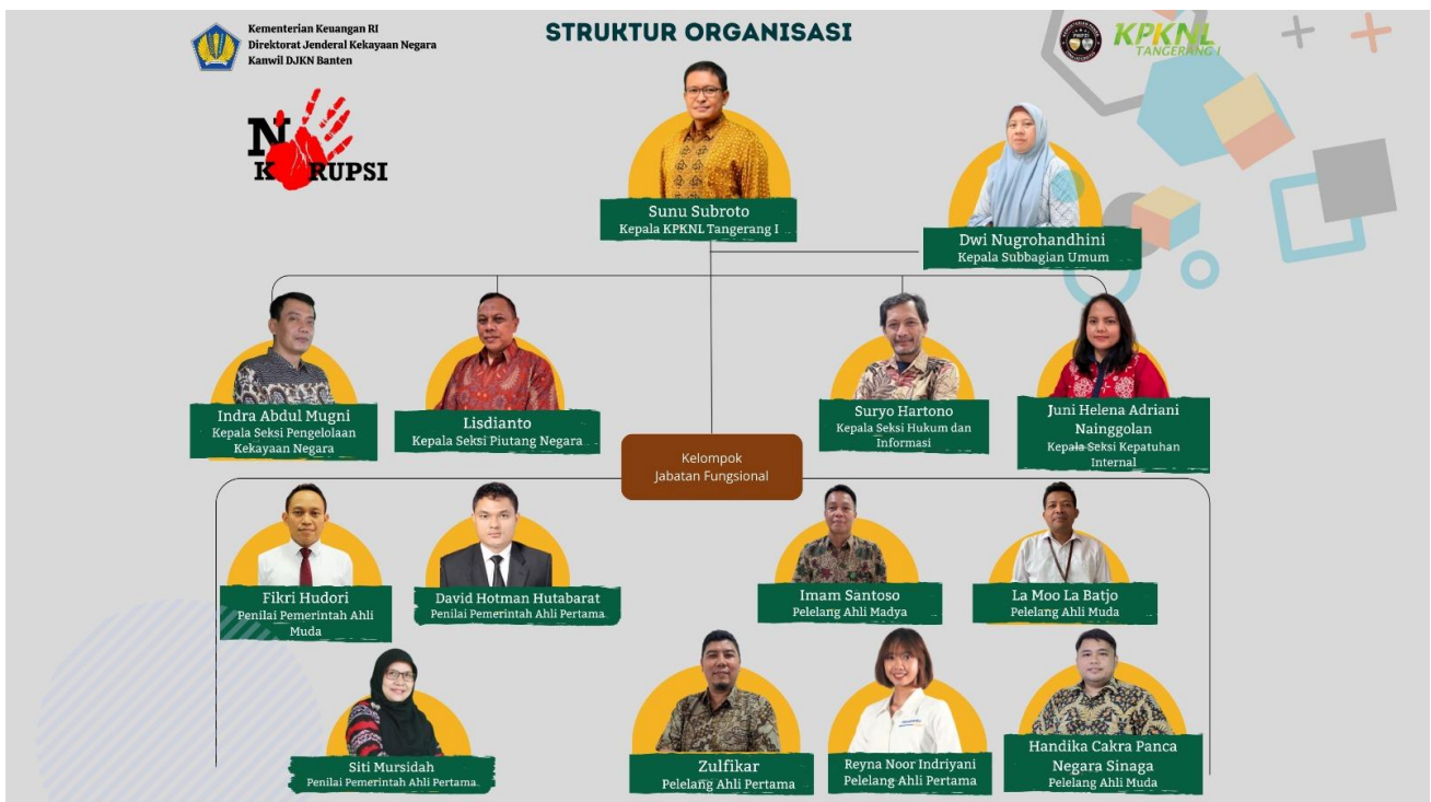
Bagan Struktur Organisasi Kantor Pelayanan Kekayaan Negara dan Lelang Tangerang I