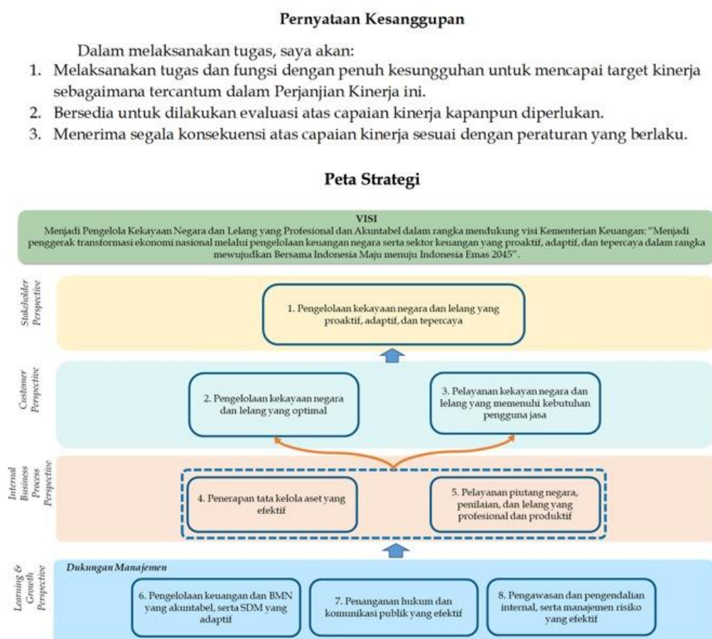
Gambar 2. 1 Peta Strategi KPKNL Banda Aceh Tahun 2025

Untuk menjamin tercapainya tujuan, sasaran dan target organisasi sebagaimana tercantum pada Rencana Strategis DJKN 2020-2024 secara optimal dan tepat waktu, kemudian dirumuskan peta strategi DJKN, yang menerapkan 4 perspektif, yaitu: stakeholders perspective , customer perspective , internal business process perspective , dan learning and growth perspective . Dalam perjanjian kinerja tahun 2025, KPKNL Banda Aceh telah menetapkan Peta Strategi sebagai berikut: