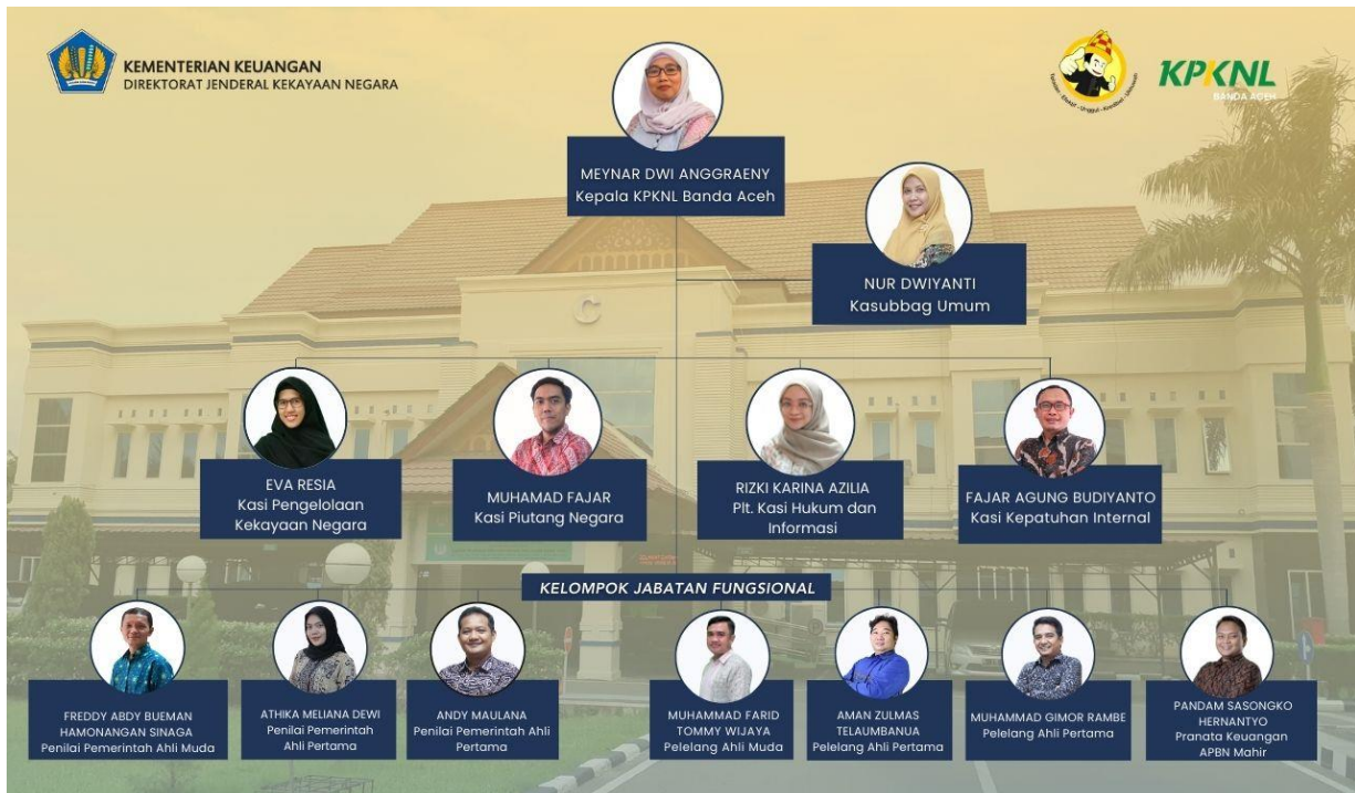
Gambar 1. 1 Struktur Organisasi KPKNL Banda Aceh

Negara, Seksi Piutang Negara, Seksi Hukum dan Informasi, Seksi Kepatuhan Internal, serta Kelompok Jabatan Fungsional.