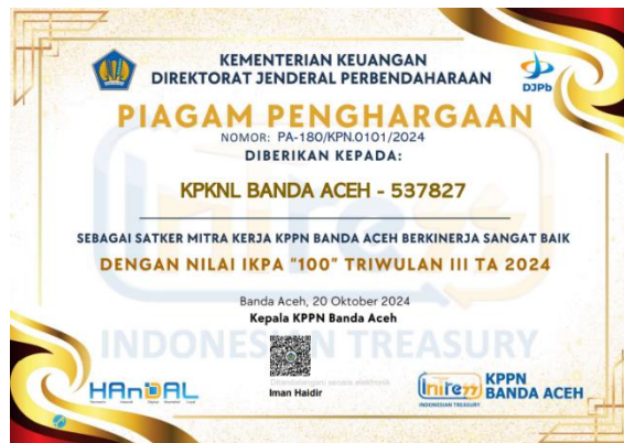
Gambar 3. 2 Piagam Penghargaan IKPA Triwulan III 2024