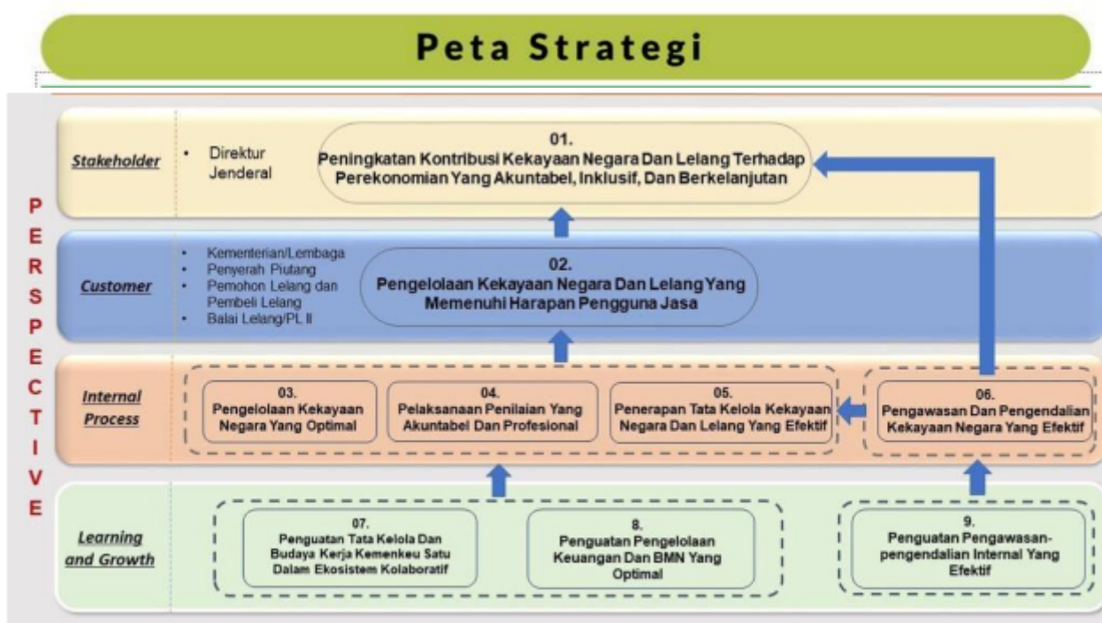
Gambar 2. 1 Peta Strategi KPKNL Banda Aceh

Perjanjian / kontrak kinerja merupakan pelaksanaan Instruksi Presiden Nomor 5 Tahun 2004 tentang Percepatan Pemberantasan Korupsi, lebih lanjut diatur dalam Peraturan Menteri Negara Pendayagunaan Aparatur Negara dan Reformasi Birokrasi Nomor 53 Tahun 2014 tentang Petunjuk Teknis Penyusunan Perjanjian Kinerja, Pelaporan Kinerja dan Tata Pelaporan Kinerja dan Tata Cara Reviu Atas Laporan Kinerja Instansi Pemerintah. Dokumen Penetapan Kinerja / Perjanjian Kinerja merupakan suatu dokumen pernyataan kinerja / kesepakatan kinerja / perjanjian kinerja antara