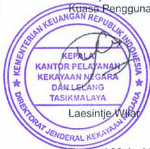
Laesintje W. War