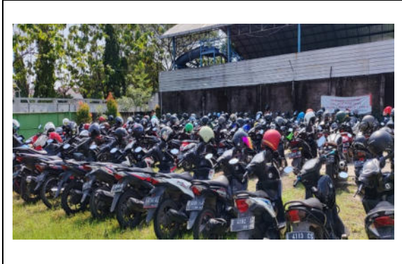
FOTO PELAKSANAAN SEWA BMN PADA KPKNL CIREBON BERUPA SEBAGIAN TANAH KOSONG SHP NO.50/KEL.SUKAPURA UNTUK LAHAN PARKIR