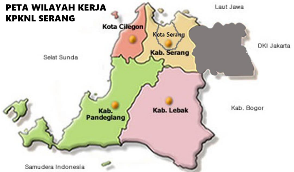
Gambar 1 Peta Wilayah Kerja KPKNL Serang

KPKNL dipimpin oleh Kepala kantor yang merupakan pejabat eselon III, dan terdiri dari 5 (lima) seksi/subbagian dan Kelompok Jabatan Fungsional dengan rincian sebagai berikut :