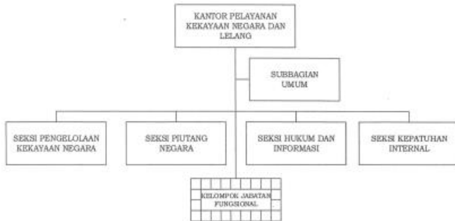
Gambar 3 Struktur Organisasi KPKNL Serang per 31 Desember 2021 Struktur Organisasi KPKNL Serang