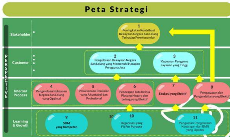
GAMBAR 2.1 PETA STRATEGI KEMENKEU THREE TAHUN 2022

Untuk menjamin tercapainya sasaran dan target secara optimal dan tepat waktu, visi dan misi KPKNL Batam harus menjadi acuan sekaligus landasan penyusunan strategi. Dari visi dan misi tersebut kemudian dirumuskan sasaran strategis KPKNL Batam. Sasaran Strategis KPKNL Batam Tahun 2022 telah ditetapkan dan dikelompokkan sebagaimana tertuang dalam Peta Strategi Kemenkeu Three Tahun 2022 yang terlihat pada Gambar 2.1. Peta Strategis Kemenkeu Three Tahun 2022 memuat 11 Sasaran Strategis dan 19 Indikator Kinerja Utama (IKU). Rincian selengkapnya tentang Sasaran Strategis dan IKU tahun 2022 dapat dilihat pada Tabel 2.2: