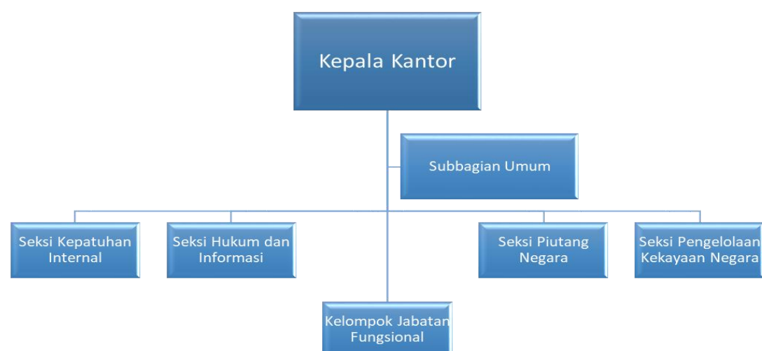
GAMBAR 1.1 BAGAN ORGANISASI KPKNL BATAM

Struktur Organisasi KPKNL Batam dapat dilihat pada Gambar 1.1 berikut.