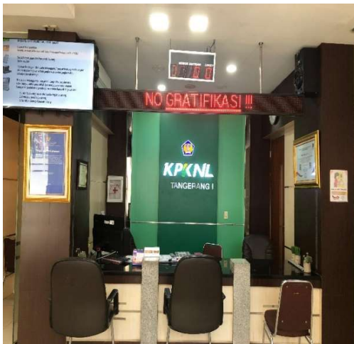
Gambar 1 : Tampilan APT KPKNL Tangerang I

KPKNL Tangerang I dalam rangka memberikan pelayanan prima kepada seluruh pemangku kepentingan untuk dapat memperoleh layanan informasi sesuai tugas dan fungsi yang diemban oleh KPKNL Tangerang I secara cepat dan efisien, telah menyediakan sarana layanan informasi dan konsultasi melalui kanal sebagai berikut: